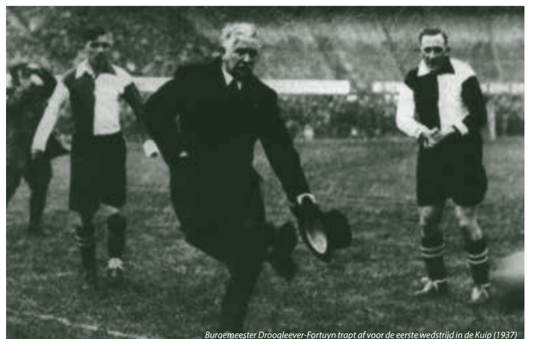
Burgemeester Droogleever-Fortuyn trapt af voor de eerste wedstrijd in de Kuip (1937)