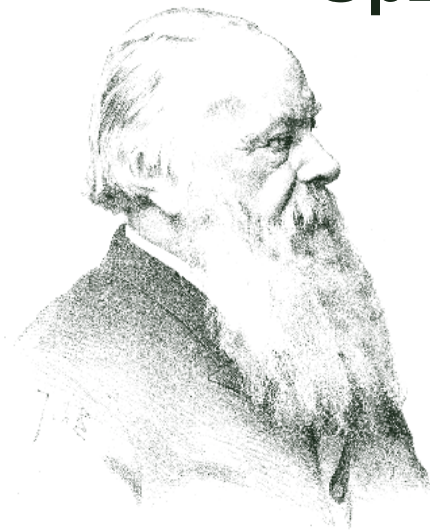
PROF. MR. C. W. OPZOOMER. 29 April 1821 - 22 Augustus 1892.