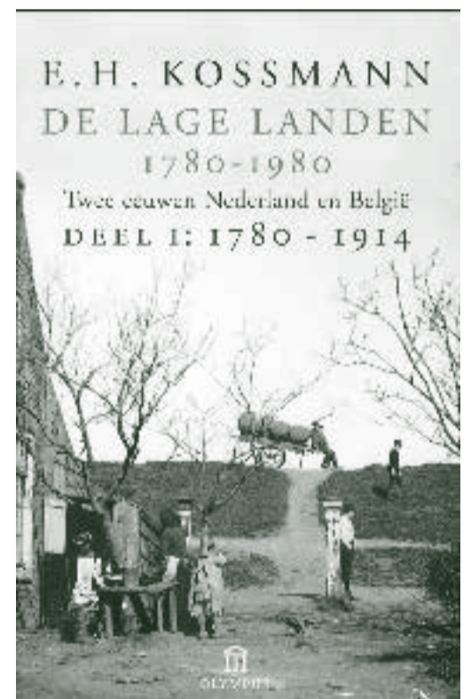
De Lage Landen 1780-1980 (laatste versie) is verkrijgbaar bij uitgeverij Olympus (928 blz.) Deel I & 2: Eur. 27,50 - ISBN: 9789046700723