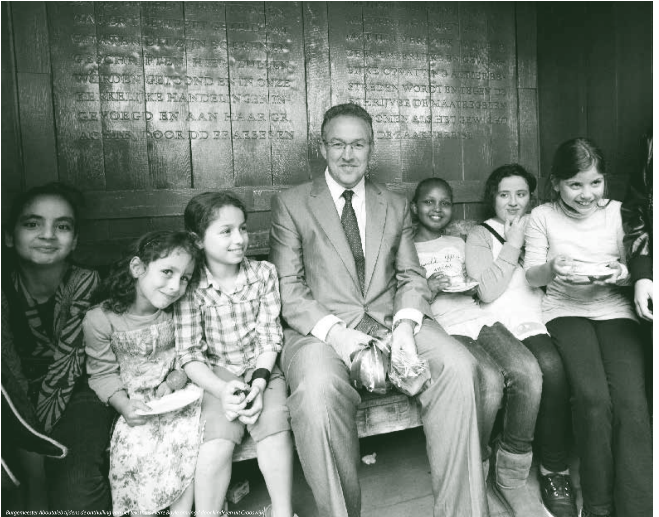
Burgemeester Aboutaleb tijdens de onthulling van het teksthuis Pierre Bayle omringd door kinderen uit Crooswijk.