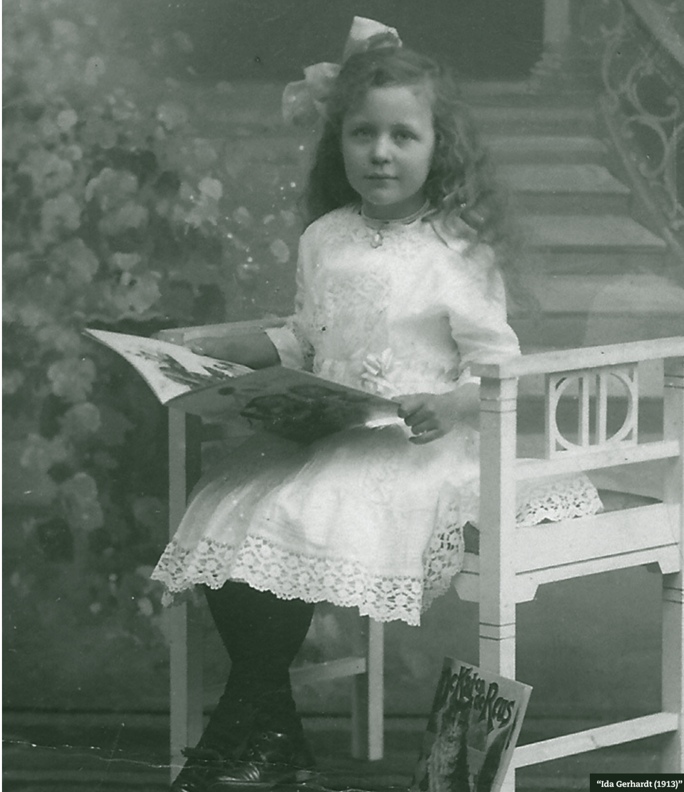
"Ida Gerhardt (1913)"