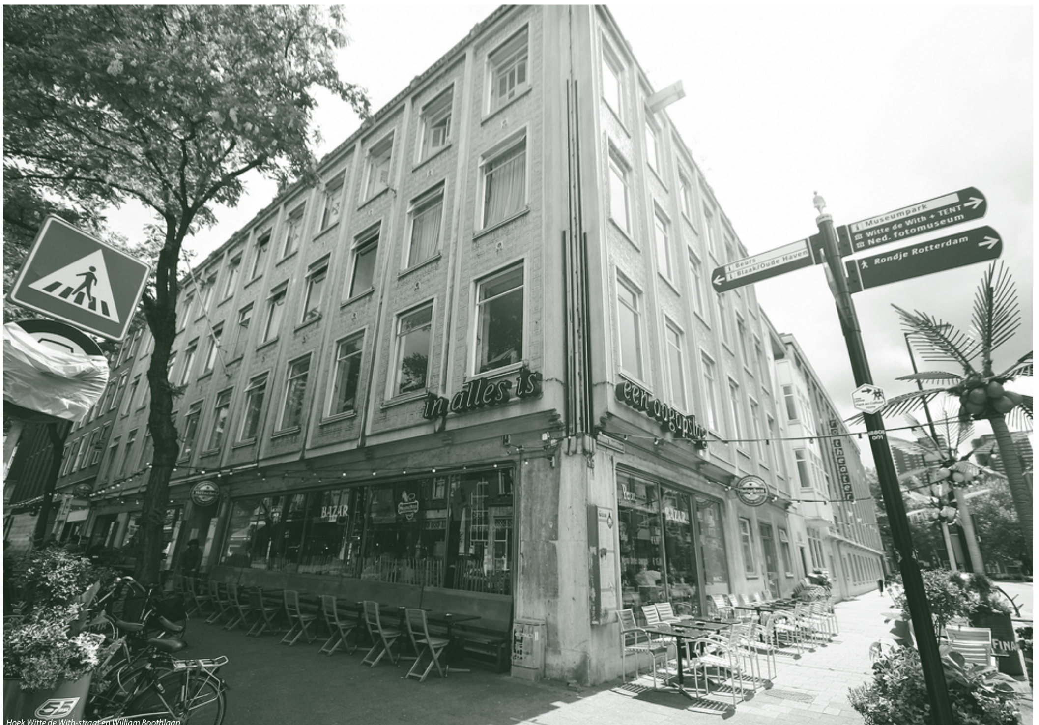
Hoek Witte de Withstraat en William Boothlaan