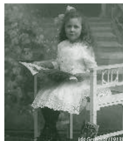
Ida Gerhardt (1913)

De klassiefoto bevindt zich in het Letterkundig Museum.