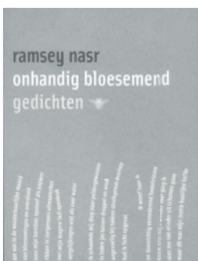
Onhandig Bloesemend (2004) Uitgeverij De Bezige Bij ISBN 978 90 2341429 2

RED: In Nederland ben je dit jaar “Dichter des Vaderlands” geworden, in België lopen ze met je weg, de DVD van “Het Echte Leven” met jou in de hoofdrol is verschenen en dan is er ook nog de langverwachte roman. Heb je het druk?